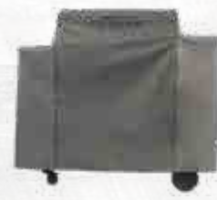
HOES - IRONWOOD IRONWOOD 650 Ref.: BAC505 IRONWOOD 885 Ref.: BAC513