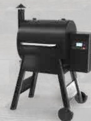
NEW PRO575 MET WIFIRE® TECHNOLOGIE TFB57GLEC (ZWART) / TFB57GZEC (BRONS)