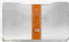
VETAFDRUIPLAAT (5 st.) PRO 575 Ref.: BAC507 PRO 780 Ref.: BAC520 IRONWOOD 650 Ref.: BAC506 IRONWOOD 885 Ref.: BAC521 TIMBERLINE 850 Ref.: BAC522 TIMBERLINE 1300 Ref.: BAC515