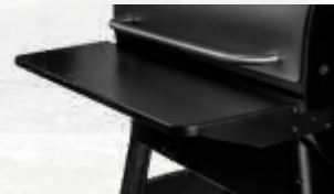
NEERKLAPBARE TABLETTEN PRO 575/IRONWOOD 650 Ref.: BAC362 PRO 780/IRONWOOD 885 Ref.: BAC442