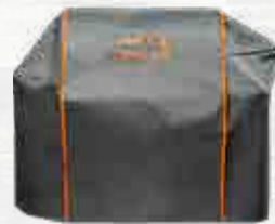
HOES - TIMBERLINE TIMBERLINE 850 Ref.: BAC359 TIMBERLINE 1300 Ref.: BAC360