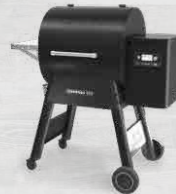
NEW IRONWOOD650 MET WIFIRE® TECHNOLOGIE TFB65BLEC (ZWART)

KENMERKEN: Ironwood D2 Controller | WiFIRE® Technologie | D2® Direct Drive aandrijving | TurboTemp® GrillGuide® | TRU Convection® Systeem | Super Smoke Modus Traeger Downdraft Exhaust® System | Temperatuursonde met opbergmodule Dubbelwandig interieur zijwanden (kuip) | 2 niveaus regelbare geëmailleerde grillroosters Dubbele positie smoke/sear onderste grillrooster Roestvrijstalen werkblad met haken | Luikje voor het ledigen v.d. pelletvoorraad