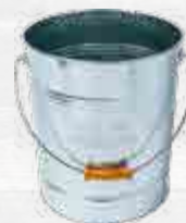
TRAEGER METALEN PELLET OPSLAGEMMER (9kg) Ref.: BAC430