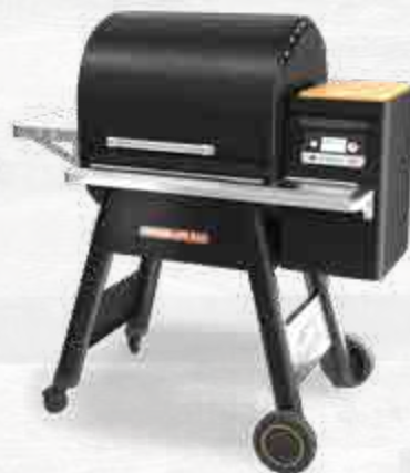
NEW TIMBERLINE850 MET WIFIRE® TECHNOLOGIE TFB85WLEC (ZWART)

KENMERKEN: Timberline D2 Controller | WiFIRE® Technologie | D2® Direct Drive aandrijving | TurboTemp® GrillGuide® | TRU Convection® Systeem | Super Smoke Modus | Traeger Pellet Sensor Traeger Downdraft Exhaust® Systeem | Temperatuursonde met opbergmodule Dubbelwandig roestvrijstalen interieur (kuip en deksel) | 3 niveaus roestvrijstalen grillroosters Dubbele positie smoke/sear onderste grillrooster | Verborgene vetopvangsysteem Roestvrijstalen tablet en werkblad met haken | Luikje voor het ledigen v.d. pelletvoorraad