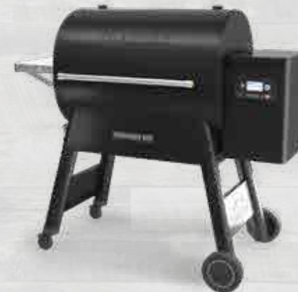
NEW IRONWOOD885 MET WIFIRE® TECHNOLOGIE TFB88BLEC (ZWART)

De geheel nieuwe Ironwood serie is er! Uw kookkunsten zullen nieuwe hoogtes bereiken dankzij de uiterst geavanceerde grilltechnologie en het superieur structureel ontwerp.