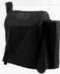
HOES - PRO PRO 575 Ref.: BAC503 PRO 780 Ref.: BAC504