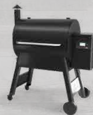
NEW PRO780 MET WIFIRE® TECHNOLOGIE TFB78GLEC (ZWART) / TFB78GZEC (BRONS)

's Werelds best verkopende houtpelletgrill, dankzij zijn klassiek ontwerp en zijn beproefde betrouwbaarheid.