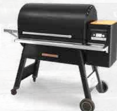
NEW TIMBERLINE1300 MET WIFIRE® TECHNOLOGIE TFB01WLEC (ZWART)

De Timberline reeks is het hoogtepunt van buitenshuis koken. De superieure structuur, het prestatieverhogend ontwerp en de beproefde technologie zorgen ervoor dat u telkens weer topprestaties kunt leveren bij het barbecueën.