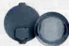
PELLET DEKSEL & FILTER KIT Ref.: BAC370